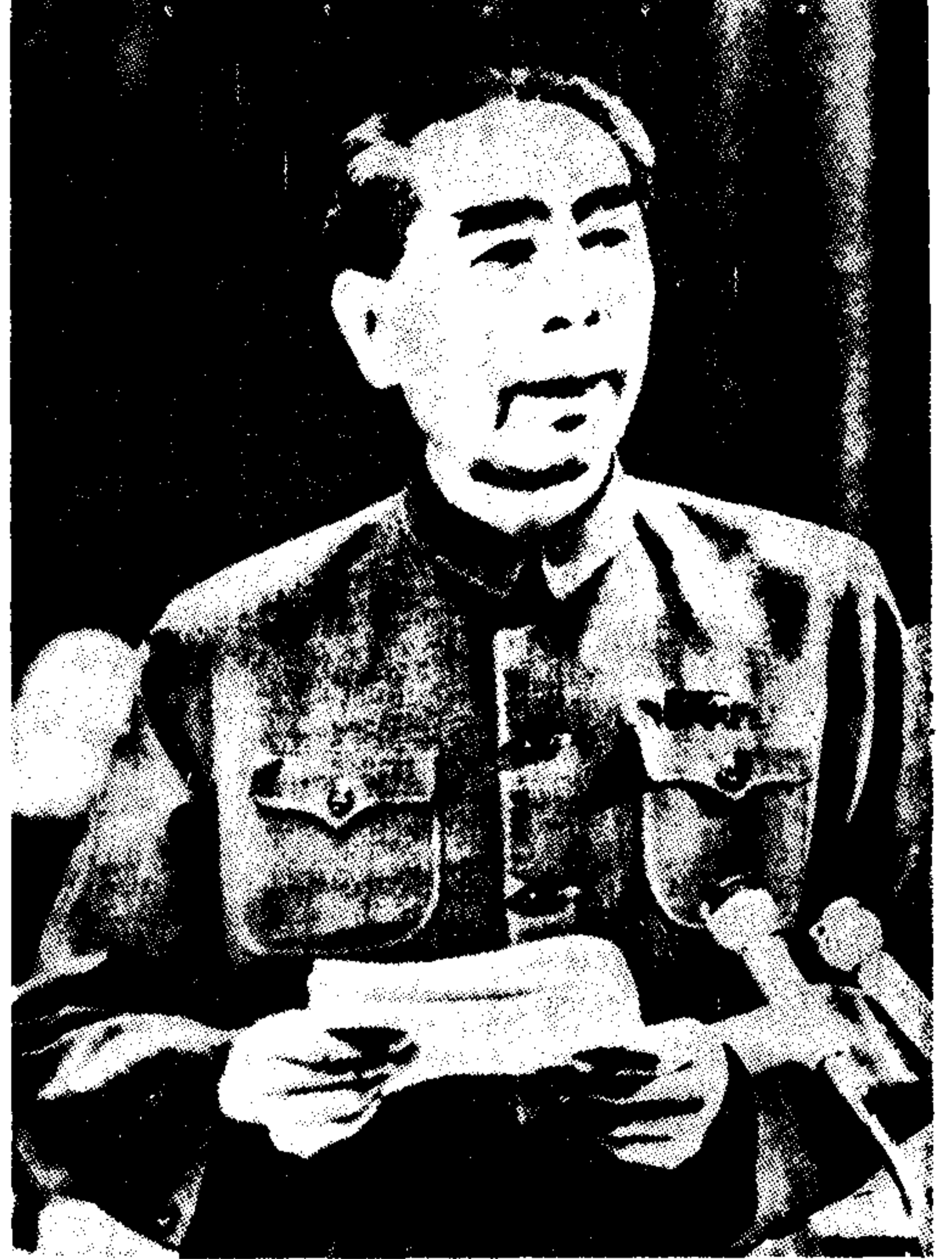
Ο Κινέζος πρωθυπουργός Τσού 'Εν Λάϊ ενώ μιλάει στη διάρκεια της μιστικής συνεδρίασης του 10ου Συνεδρίου του Κινεζικού Κομμουνιστικού Κόμματος...